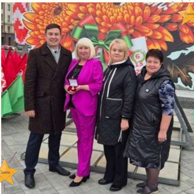
На торжественном вручении в Минске